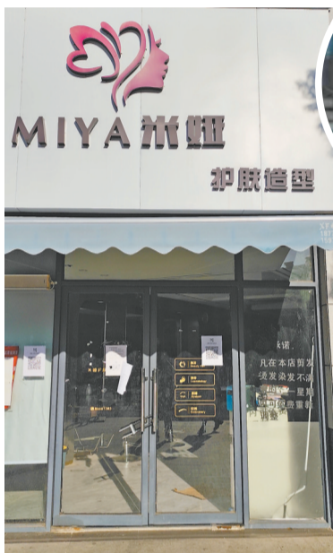
▲ 米娅美容美发店大门紧闭,内部还有一些美容美发器具。

11月27日,记者来到南昌市红谷滩区市场监督管理局沙井分局了解情况。该部门相关工作人员表示,已接到130多名米娅美容美发店会员的反映,经初步统计,涉及金额40余万元。“目前,我们还在针对此事展开调查。”该工作人员表示。